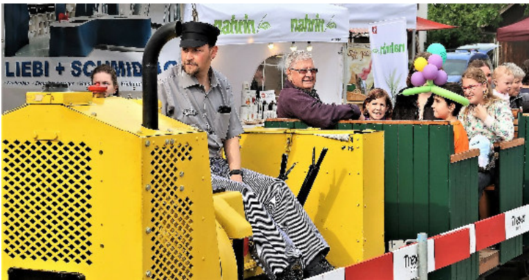
Strahlende Gesichter auf der Bergwerkbahn.

DIE BERGWERKBahn bildete an der Gewerbearena Herznach vom 17. bis 19. Mai 2019 eine Attraktion, die Goss und Klein anzog und zu einer Fahrt anlockte. Der Aufwand der VEB-Bahngruppe für Aufbau, Betrieb